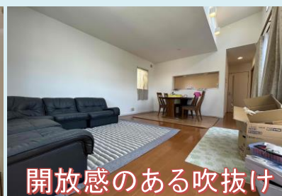
開放感のある吹抜け